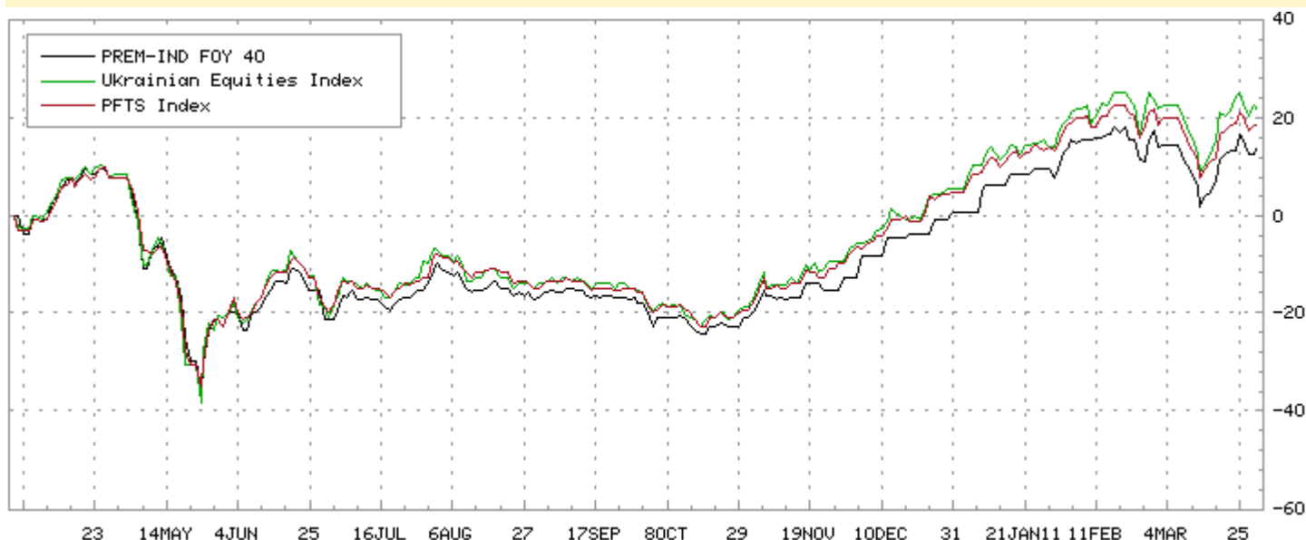
График доходности инструмента ETFUA